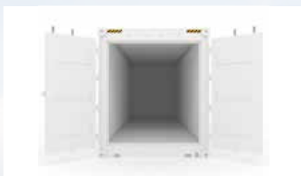
CONTENEDOR ABIERTO 40' FLAT RACK