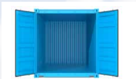
CONTENEDOR ABIERTO 20' OPEN TOP