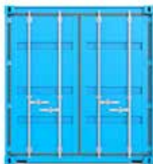
CONTENEDOR DRY-VAN 20'