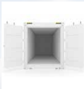
CONTENEDOR REEFER 20'